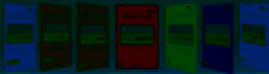
厚度 密度 效度 乐度 适度